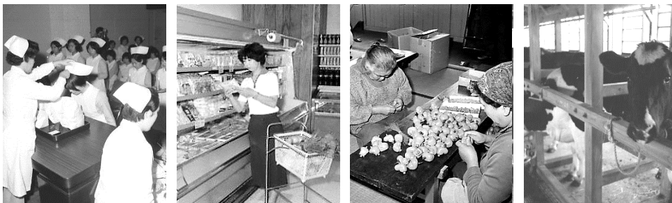
（左から）高等看護学院戴帽式／昭和49年5月10日／67304 買い物風景(1)新田塚ファミリープラザ／昭和55年5月29日／66421 家内労働／昭和48年5月23日／66421 上庄畜産団地外／昭和48年5月28日／66431